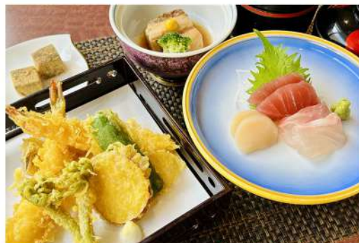
こけし膳 1,800円 (天麩羅・刺身・角煮・御飯・味噌汁)