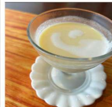
【スープ】 ・本日のスープ