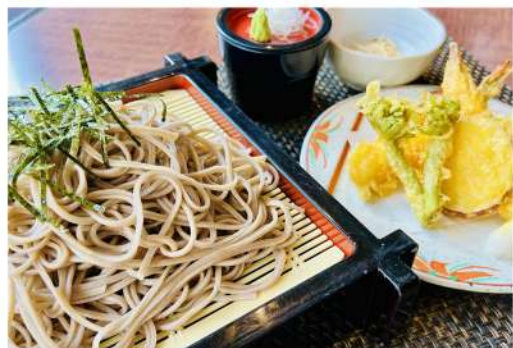
天婦羅蕎麦セット 1,500円 (蕎麦・天婦羅・小鉢) Drink Menu