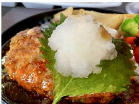
本日のハンバーグセット 1,500円 (ライス・サラダ・スープ)