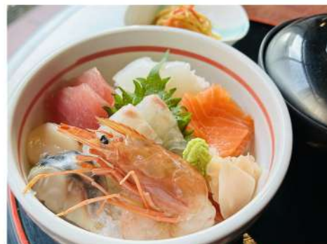
ちらし膳 1,500円 (ちらし・小鉢・お吸い物)