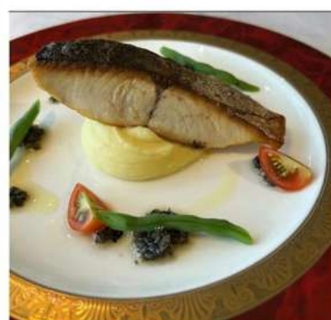
【メイン】 ・サワラのソテー タブナードソース ・ライス ※パンに変更の場合+200円