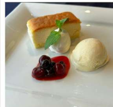
【デザート】 ・チーズスフレケーキ